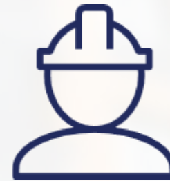
ABLOY Koti - lukitusratkaisut